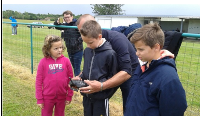
Initiation au pilotage

Notre journée portes-ouvertes à laquelle participent les Verniollais mais aussi trois collèges de la Région, le collège Pierre Bayle et l'EREA de Pamiers, le collège du Girbet à Saverdun. Cette année encore, près