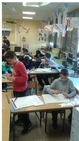
Séance de construction au Collège Bayle de Pamiers

Sport de rigueur, de précision, de concentration, de régularité, la pratique de l'aéromodélisme développe et exige équilibre, volonté, maîtrise de soi, résistance au stress. Cette concentration permet de faire le vide et permet de se ressourcer dans un cadre très amical. La recherche de la performance s'associe à la beauté et à la pureté du résultat des évolutions en vol. Il est à noter que cette année notre fédération nous a classé premier club d'aéromodélisme Français parmi plus de 840 association d'aéromodélisme. Nous devons ce résultat à la générosité de tous les adhérents, à la convivialité et à l'encadrement de plus de 150 jeunes au travers des actions mises en place dans les établissements scolaire.