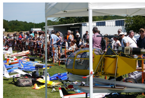
Le public est venu très nombreux cette année pour fêter les 50 ans de notre Fédération

Une année particulière pour notre super Show aéromodélisme Verniollais. En effet, nous avons été sélectionnés par notre fédération pour la représenter à l'occasion de son cinquantenaire. C'est près de 40 pilotes parmi les plus chevronnés de la Région et plus de 80 machines. Ces pilotes ont fait le déplacement de tout le Sud-ouest de la France, pour nous faire partager, des évolutions époustouflantes fleurant souvent avec les limites des lois de l'apesanteur. Monomoteur, multimoteurs, réacteurs, pulso-réacteur et même planeurs, avions et hélicoptère ont ravis les yeux (et les oreilles) d'un public venu en masse, au travers un magnifique spectacle aérien toujours gratuit.